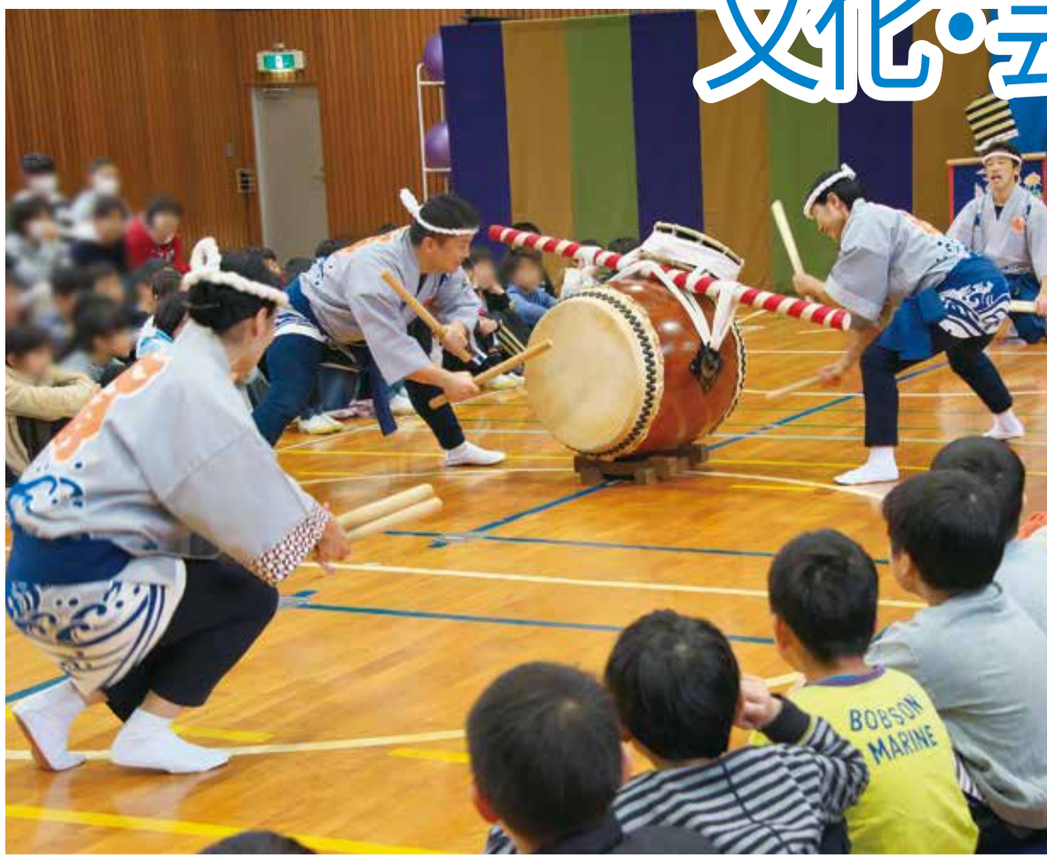
小学校での鑑賞教室の様子